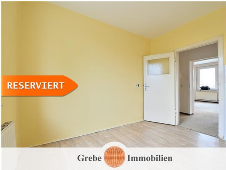
Küche Bild 2